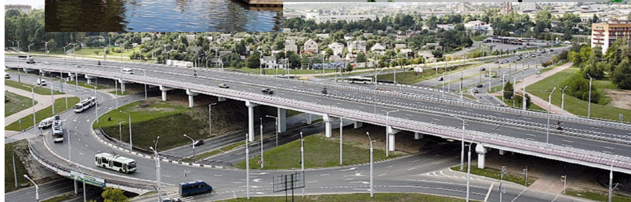
Трехуровневая транспортная развязка на пересечении проспектов Жукова и Дзержинского в г. Минске, длиной 458,3 м, на 375 буронабивных сваях. При устройстве 17 пролетов эстакады использовано 272 железобетонные балки длиной от 18 до 33 м (2012 г.)