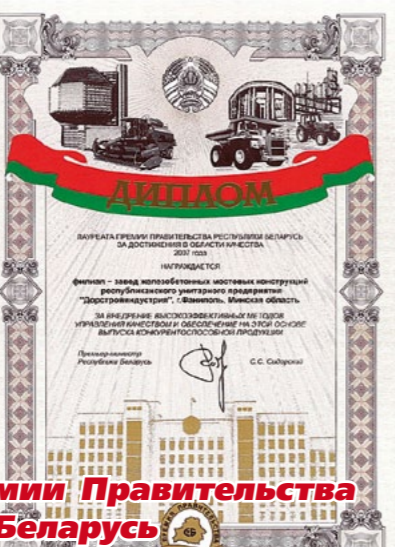
Лауреат Премии Правительства Республики Беларусь за достижения в области качества

Обладатель Знака Почета «Лучшая компания СНГ»